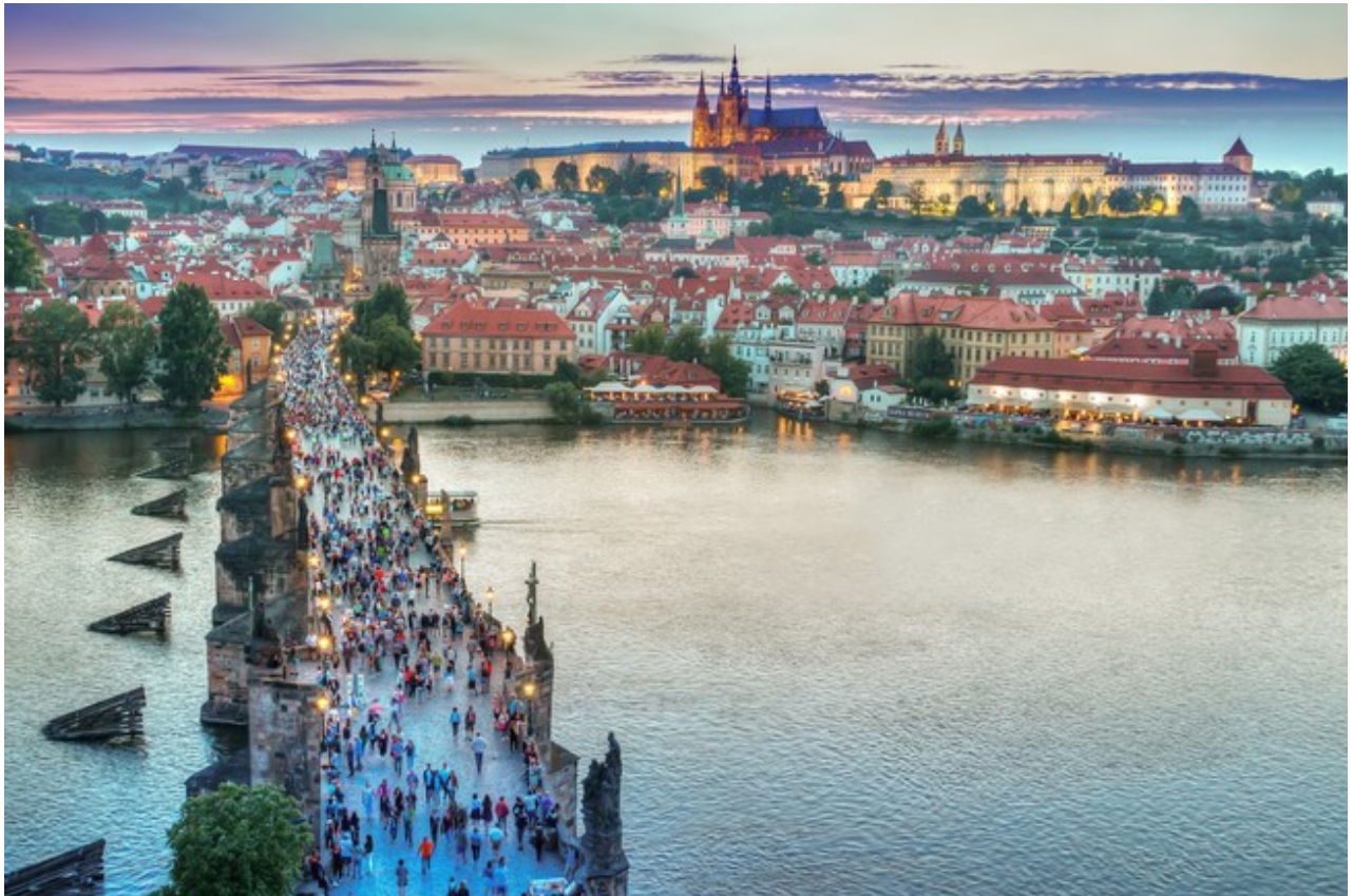
布拉格城市輪廓及著名的查理大橋(Karlův most)