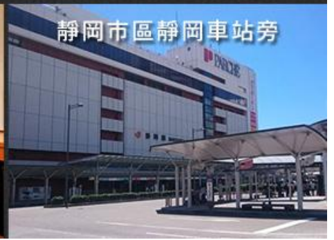
靜岡市區靜岡車站旁

靜岡縣位於日本中部地區東南部，面對太平洋。處在東京和大阪之間，自古以來作為東西文化和經濟的交流地區逐漸繁榮發展起來。在靜岡有海拔 3776 米的日本最高峰 - 富士山；靜岡憑藉適合茶的氣候和高超生產技術，成為品質和產量位居日本第一的茶生產基地。